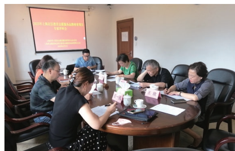
上海社区教育志愿服务品牌培育项目评审会召开