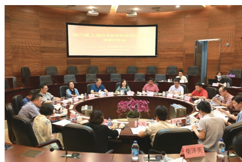
学指办召开第六届上海社区教育教学评比 (复赛)专家评审会